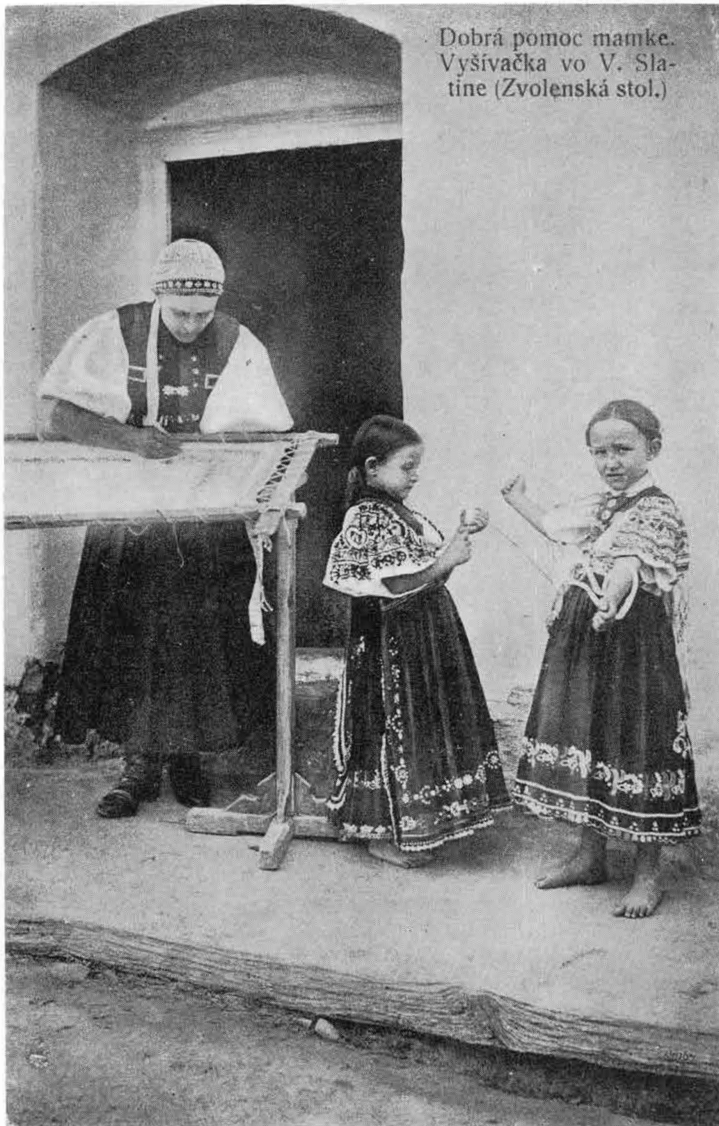
Dobrá pomoc mamke. Vyšivačka vo V. Slatine (Zvolenská stol.)