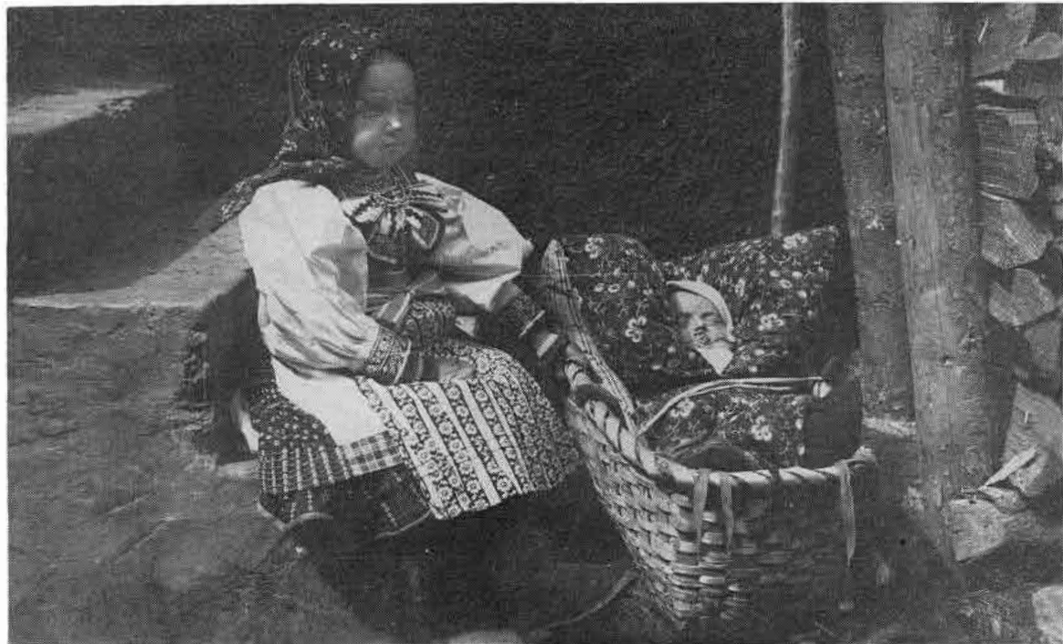
3. Opatera mladšieho súrodenca. Važec. okolo r. 1930