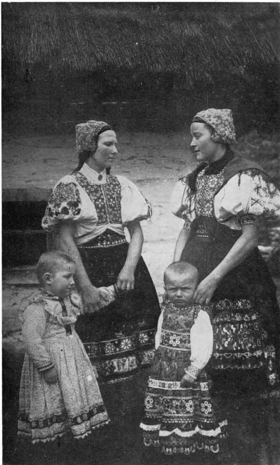
2. Ženy s dětmi z Abelovej. okolo r. 1930