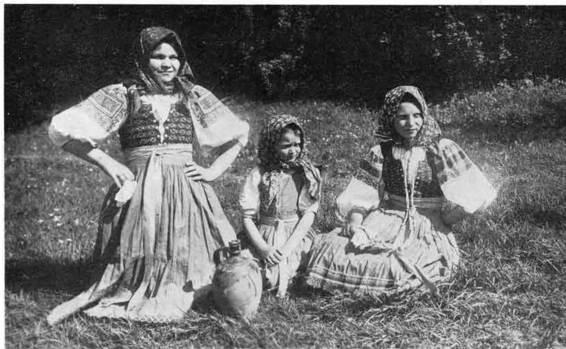
4. S občerstvením na pole. Trenčianska Teplá. okolo r. 1930